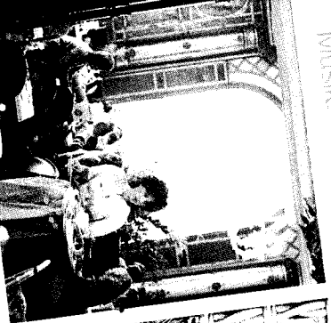
»Radio Charivari schafft überall Atmosphäre.«