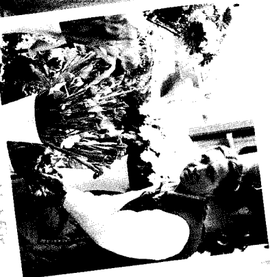
»Radio Charivari ist für mich wie ein Blumen- strauß – voller Farbe, der Freude bringt.«