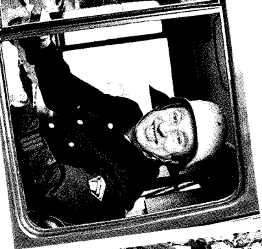
»Brandheiß und immer dabei, so braucht's die Feuerwehr auch bei der Musik.«