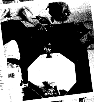
»Radio Charivari ist die tolle Dauermelodie, die bringt Schwung in den Tag.«