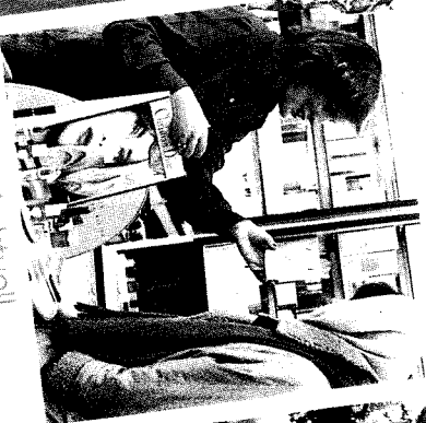
»Bunt und aktuell. Radio Charivari hilft mir verkaufen.«