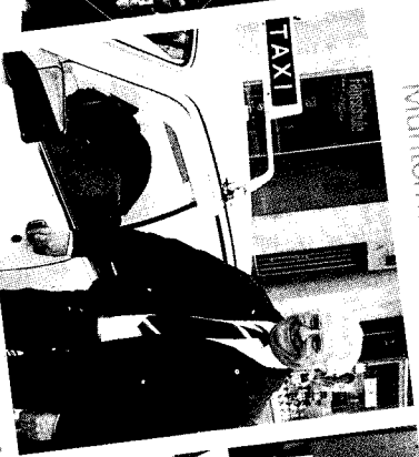
»Wir sind beide immer auf vollen Touren. Das gefällt mir an Radio Charivari.«