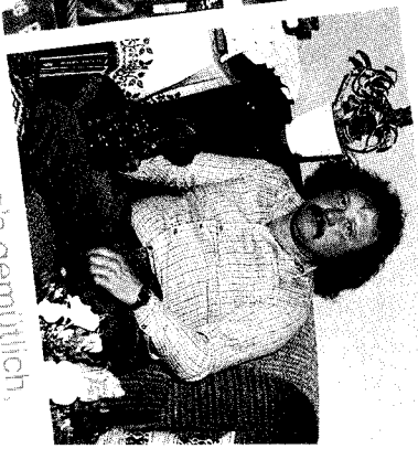
»Ich mag's gemütlich, – mit Radio Charivari.«