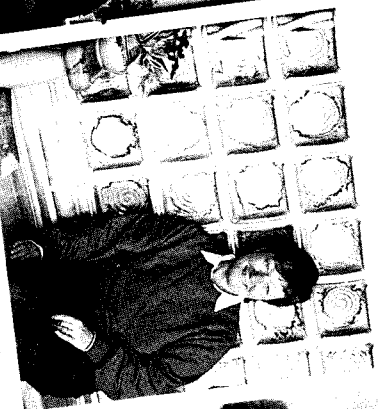
»Radio Charivari heizt ganz schön ein. So mag ich es am liebsten.«