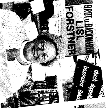
»Bayrisch und frisch – so wie meine Brezn.«