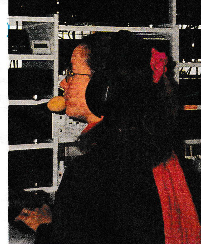
Verträumter Studiogast bei Barbara im Senderaum von Radio Sonnenschein