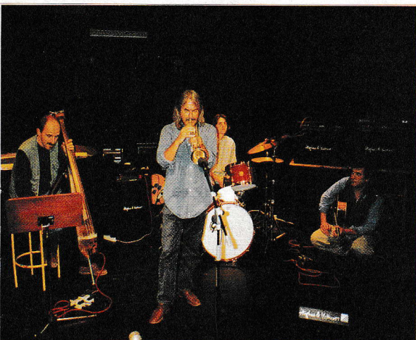
Bei Mr. Music wir vorwiegend authentische Musik spielt.

Zur Musik bringen wir als Ergänzung immer wieder verschiedenste Musikberichte (Musiker und Bands werden vorgestellt, eine Plattenneuerscheinung wird besprochen usw.) und es gibt Konzerthinweise.