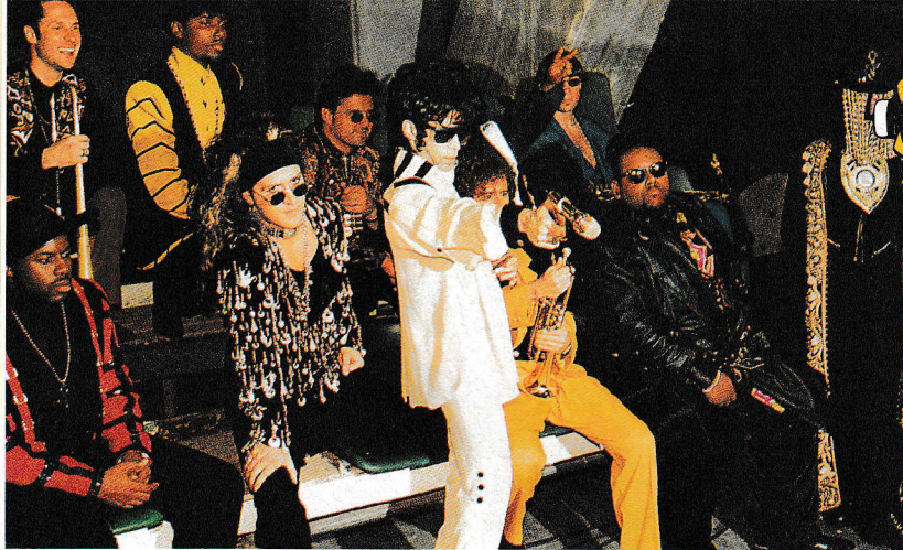
Prince mit seiner Band The New Power Generation