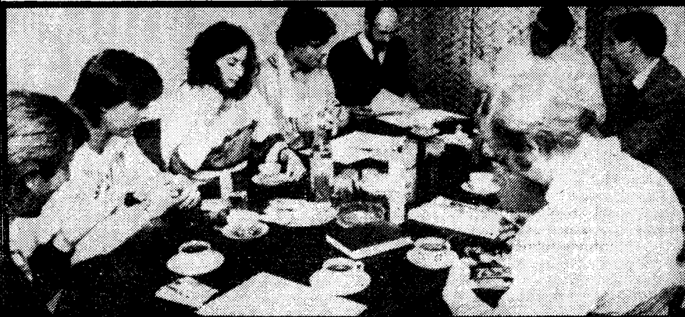
Programmsitzung im Stile großer Rundfunkanstalten: Radio Brenner

kaufkräftigste Bevölkerungsschicht ausmacht und Kaufkraft natürlich bei den von Werbespots abhängigen Privatstationen enorm wichtig ist. Ohne Werbespots kann kaum eine privatwirtschaftlich geführte Station überleben und so werden die Programme zielgruppengerecht gestaltet, zumal laufend Erhebungen durch Marktforschungsinstitute, die Einschaltquoten und Werbewirksamkeit überprüfen, stattfinden.