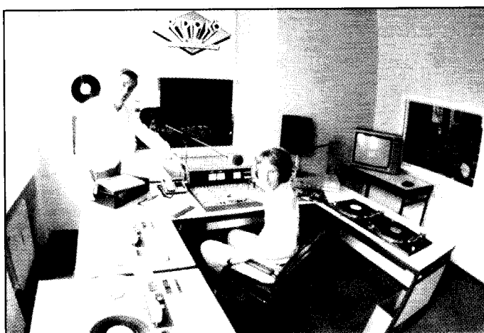
Bedienungsfreundliche Technik im Studio