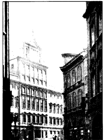
Die Augsburger Börse, direkt gegenüber dem Rathaus, war 1935 die Geburtsstätte des ersten Schwaben-Senders.

Das Programm des neuen Schwabensenders war voller guter Vorsätze. Man wollte weg von „trockener Fachwissenschaft und schulmeisterlich lehrhaftem Ton“. Das Motto lautete: „Aus dem Volk heraus und durch das Volk selbst wollen wir sagen, was wir zu sagen haben.“