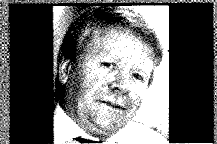
Ex-Fußball-Nationalspieler Helmut Haller