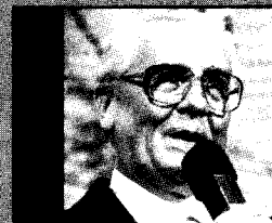
Verkehrsdirektor Fritz Kleiber

Die Themen-Palette der RADIO KÖ-Reporter ist weit gespannt. Sie reicht von der interessanten Gerichtsverhandlung bis zur Stadtratssitzung, die aktuellen Verbraucherpreise auf dem Stadtmarkt interessieren uns ebenso wie die Pressekonferenz des Oberbürgermeisters. RADIO KÖ kümmert sich um die Situation im Straßenverkehr ebenso wie um Ereignisse aus dem sportlichen, kulturellen und wirtschaftlichen Zeitgeschehen. Und immer steht die Aktualität im Mittelpunkt.