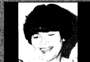
Olympiasiegerin Heidi Schmid-Grundmann