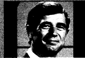
Doppel-Olympiasieger Dr. Erhard Keller