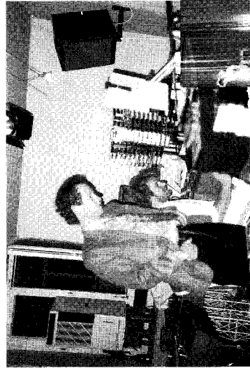
i-Punkt: Montags bis freitags von 16.00–17.00 Uhr. Hier: Sportnews mit John Mc Enroe.