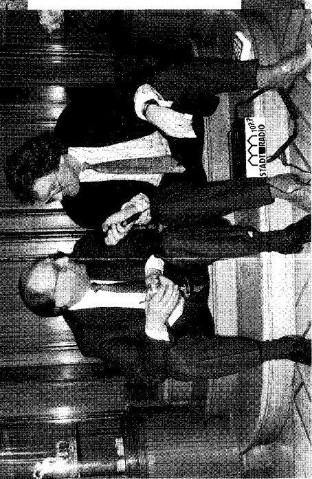
Mittagsmagazin: Täglich, außer sonntags, von 12.00–14.00 Uhr. Vor dem STADT-RADIO-Mikro gab Lolhar Späth Auskunft.