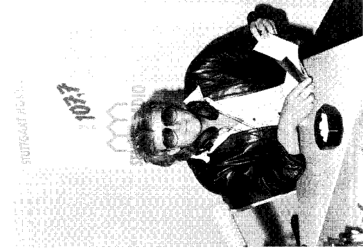
Cocktail: Täglich, außer sonntags, von 14.00–16.00 Uhr. Zu Gast im Studio: Howard Carpendale.