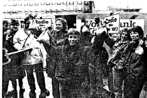
ERÖFFNUNGSFEIER mit Hörern: Der Start von Radio Köln auf dem Roncalliplatz.

Während sich im Rheinisch-Bergischen und Oberbergischen Kreis die durch die gesellschaftlich relevanten Gruppen benannten Mitglieder von Beginn an zu einer gebietsübergreifenden Veranstaltergemeinschaft zusammengeschlossen hatten, waren im Rhein-Sieg-Kreis und der kreisfreien Stadt Bonn die Gründungen selbständiger Veranstaltergemeinschaften in Gang gesetzt worden. Durch die Entscheidung der Landesanstalt für Rundfunk, Bonn und den Rhein-Sieg-Kreis als ein Lokalfunkverbreitungsgebiet zu definieren, kam es auch hier zu einer gebietsübergreifenden Veranstaltergemeinschaft.