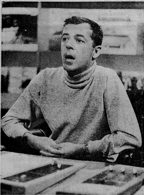
Karrierestart beim Soldatensender BFBS: Chris Howland.

Bei dem britischen Militärsender begann einst Chris Howland seine Karriere