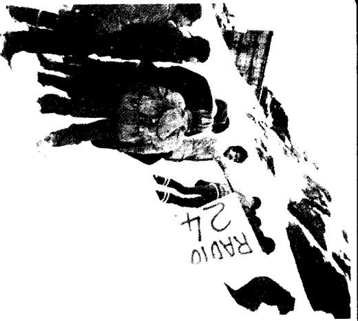
Foto: Radio-24-Fans bei schneidender Kälte auf dem Pizzo Groppera

Fotografierenden Personen wurden die Filme aus den Kameras entzissen, wie der „Blick“ zu berichten wußte. Dann sorgten Carabiniers — einige waren aus dem Erdbebenkatastrophengebiet in Südtalien abkommandiert worden — dafür, daß die Schweißrenner in Aktion treten konnten. Schlüssel zum Senderaum hatte man nicht. Beamte der Escopost zerschnitten Kabel und versiegelten hinterher die Räume. Um 13.14 Uhr,